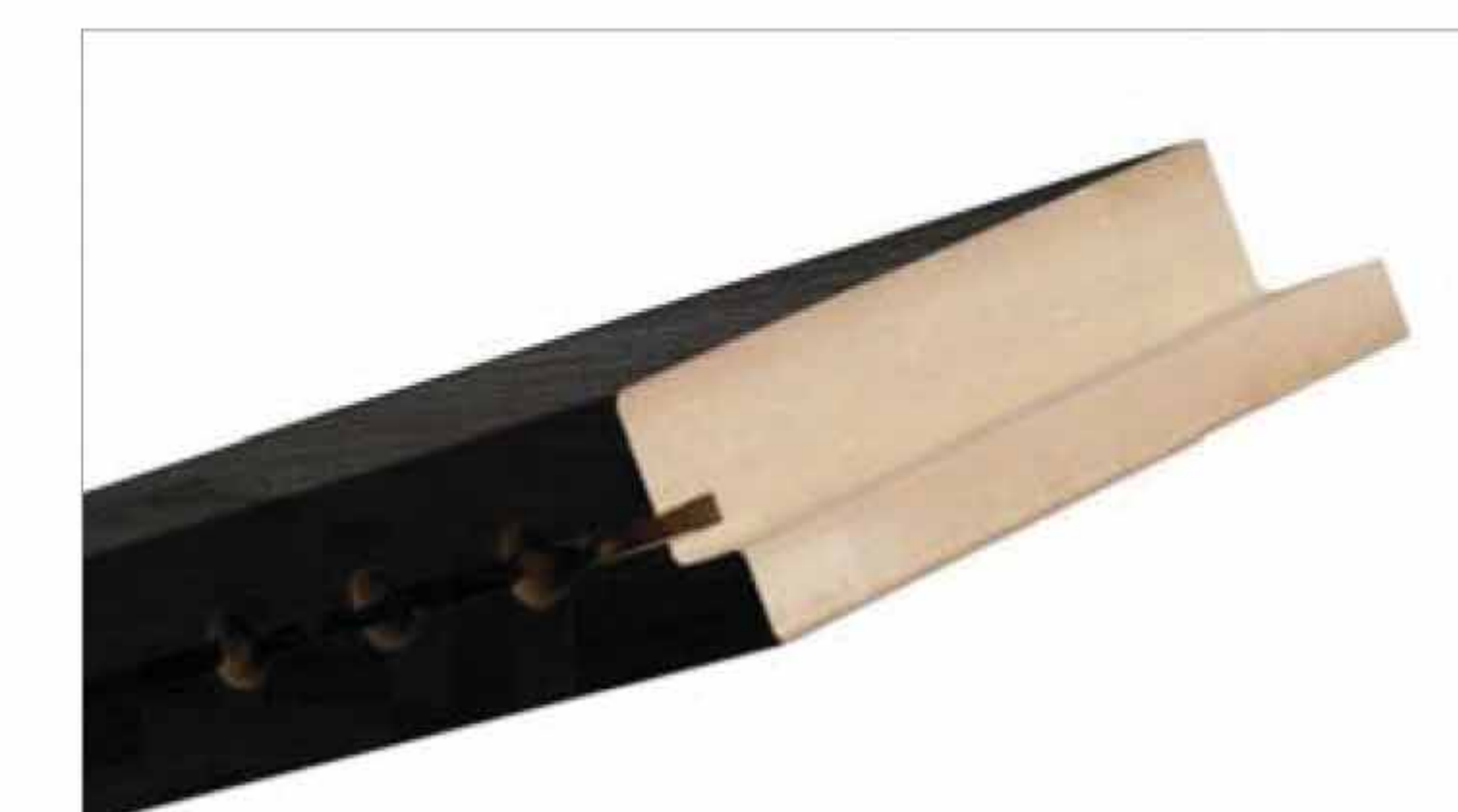
Lita – masywna konstrukcja RAMOWA